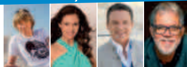
Mickie Krause, Anita Hofmann, Stefan Mross und Wolfgang Trepper