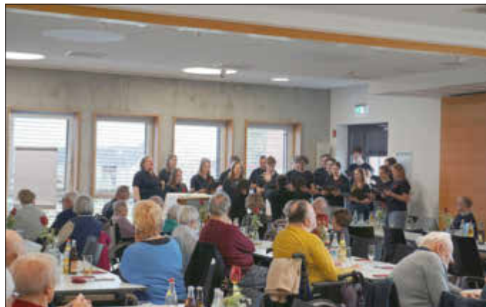
Der Triesdorfer Chor begleitete musikalisch das Jubiläum.